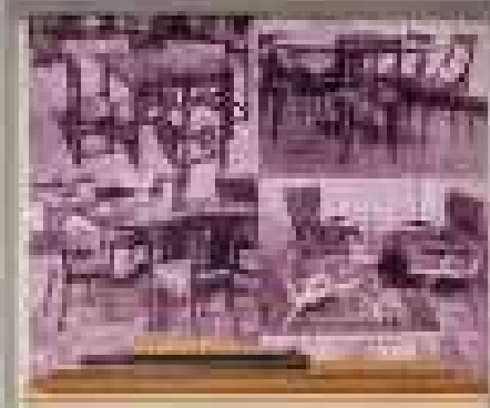
Sense títol , 2014 Fotografies giclée Col·lecció Pep Duran, Barcelona