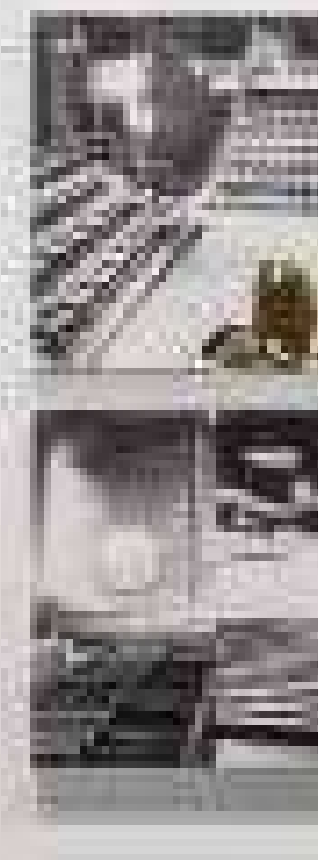
Grades , 2009 Col·lecció Pep Duran, Barcelona