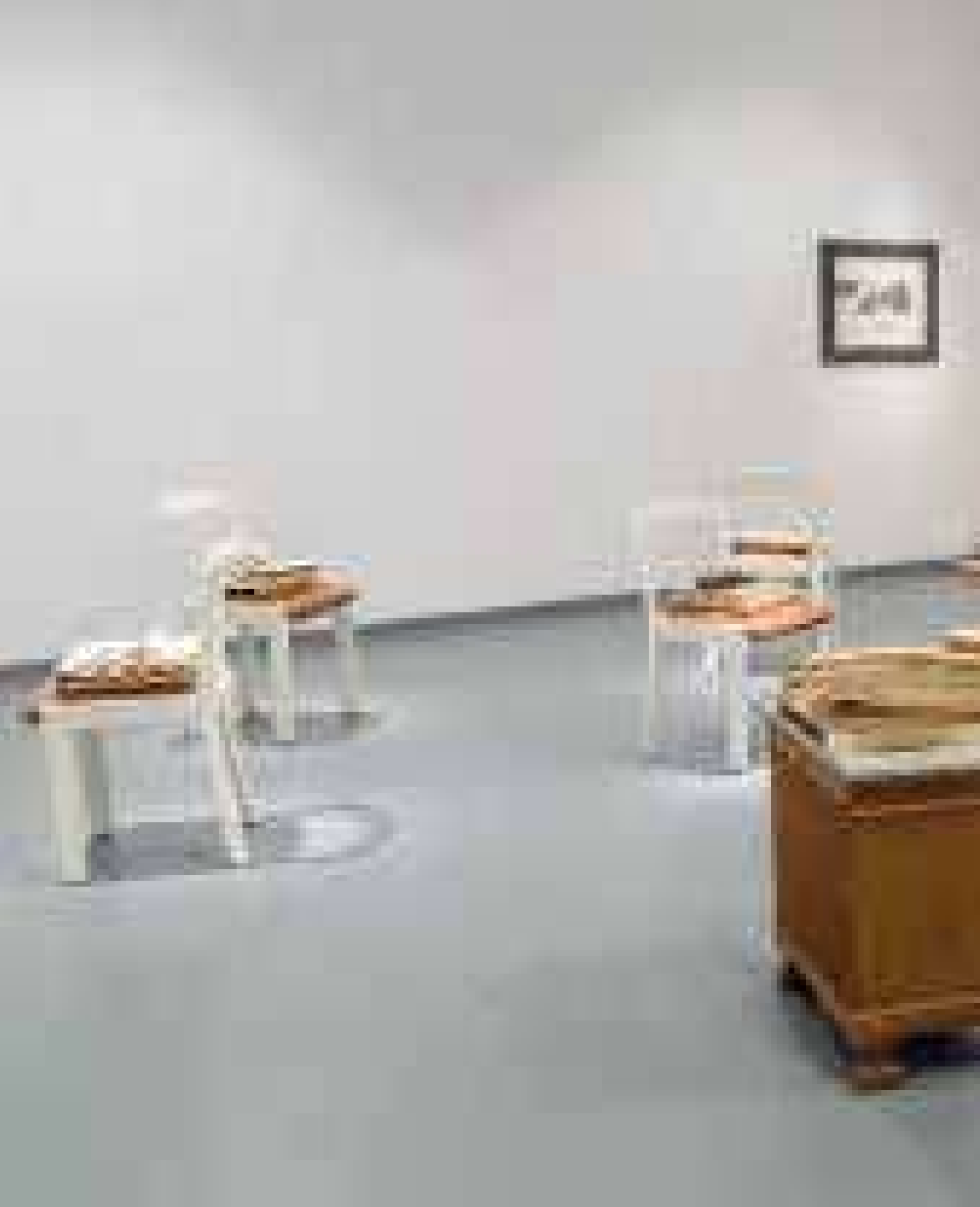
Instal·lació Dibuixar els dies , 2020 Realitzada in situ als espais de la Fundació Vallpalou, Lleida