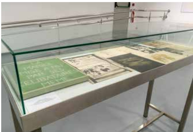
Marcel Duchamp. La Mariée mise à nu par ses célibataires / Green Box, 1934

En 1913, el Desnudo bajando la escalera de Duchamp, que se había expuesto en las galerías Dalmau de Barcelona un año antes en la Exposición de Arte Cubista, triunfó en la muestra del Armory Show de Nueva York. Man Ray y Duchamp se conocieron en Nueva York en 1915, allí coincidieron con el fotógrafo