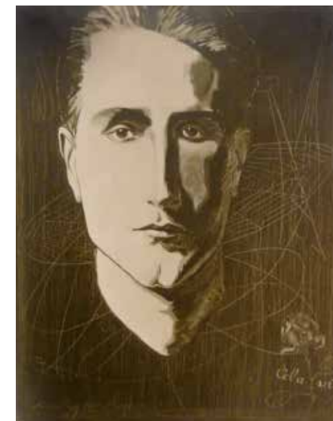
Man Ray. Cela vit , c. 1923 Gelatina de plata 20 x 16 cm Colección Fundació Vallpalou, Lleida

Picabia, tras un periodo pictórico cubista y futurista, lideró el movimiento Dadá, publicó revistas como Cannibale (1920) y colaboró con sus dibujos en la revista Littérature, nouvelle série , dirigida por André Breton desde 1922 y hasta el 1924. En 1917 publicó el primer número de la revista dadaísta 391 en Barcelona. La cubierta es una máquina que tituló NOVIA. En 1922 expuso en las galerías Dalmau de Barcelona una exposición de Máquinas y Españolas y el catálogo lleva un prefacio de André Breton.