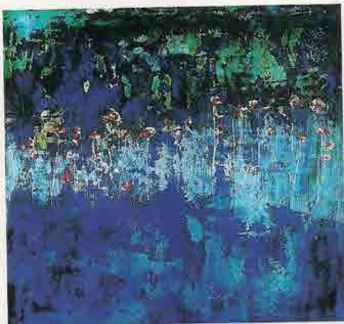
COMPOSICIÓ FUSTA NÚM. 121 2002 (150x50)