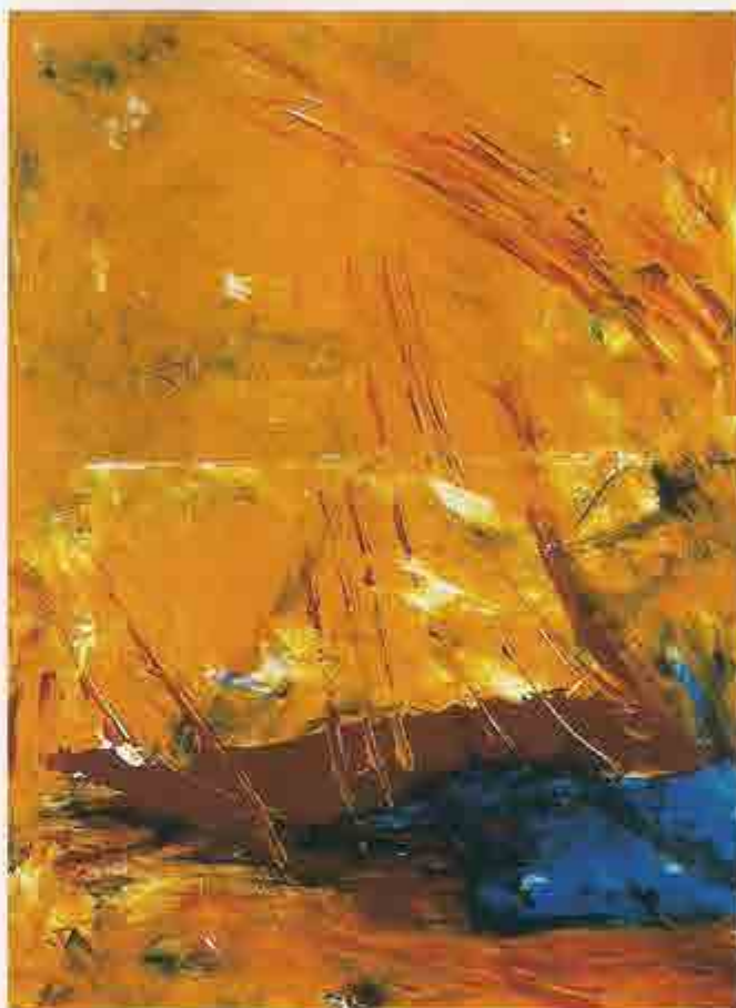
Groc núm. 19 1999 (42x30) ACÍLIC SOBRE PAPER