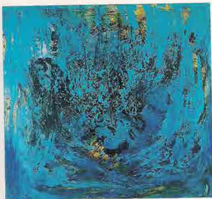
COMPOSICIÓ FUSTA NÚM. 119 2002 (100x100)

L'ESCLAT DEL VERMELL TRIOMFANT ENS SUGGEREIX UN INICI DE VIDA MÉS RELACIONAT AMB LA SANGÜE QUE AMB EL FOC. AQUEST EFECTE S'ACONSEGUEIX AMB LA DIRECCIÓ DEL TRAC I EL JOC DE TONS DE DIFERENTS INTENSITATS, AJUDAT PEL RITME CORB DE LES LÍNIES NEGRES DE LA BASE.