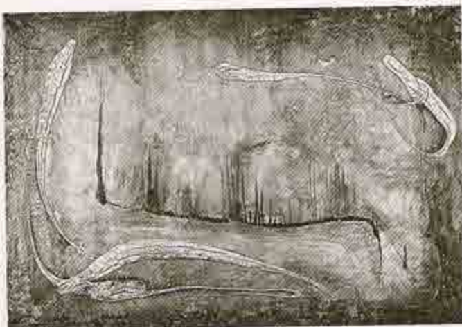
INDOLENCIA (1986) (113x82)