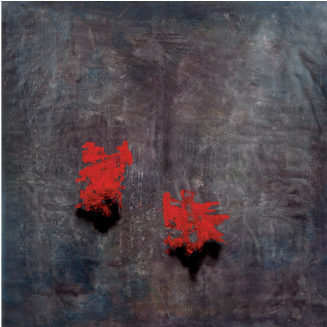
Vall Palou - Acrylic on canvas - 200x200 cm - 2012