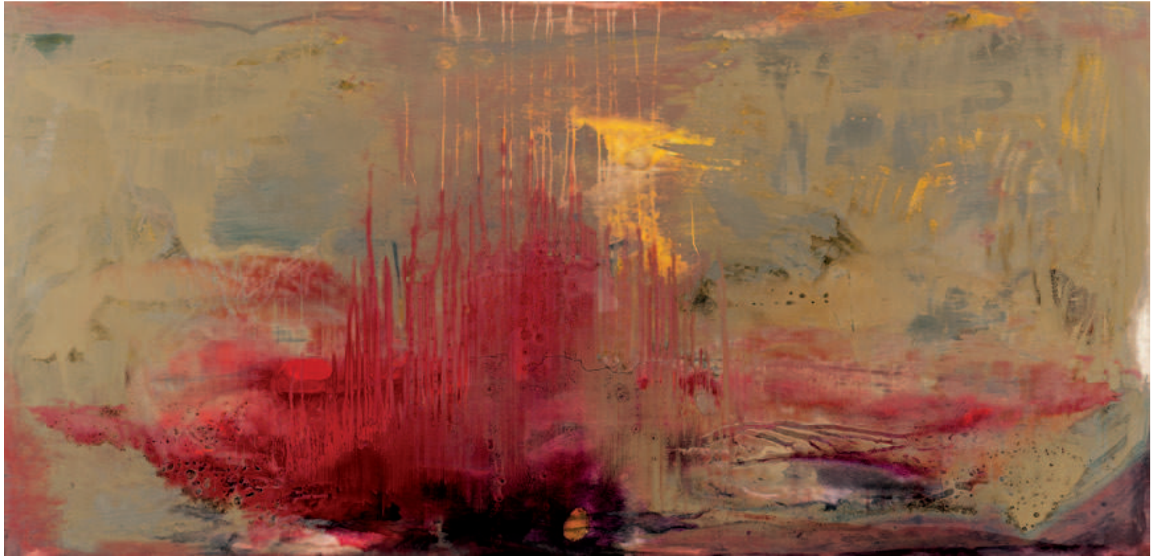
Vall Palou - Acrylic on wood - 250x122 cm - 2013