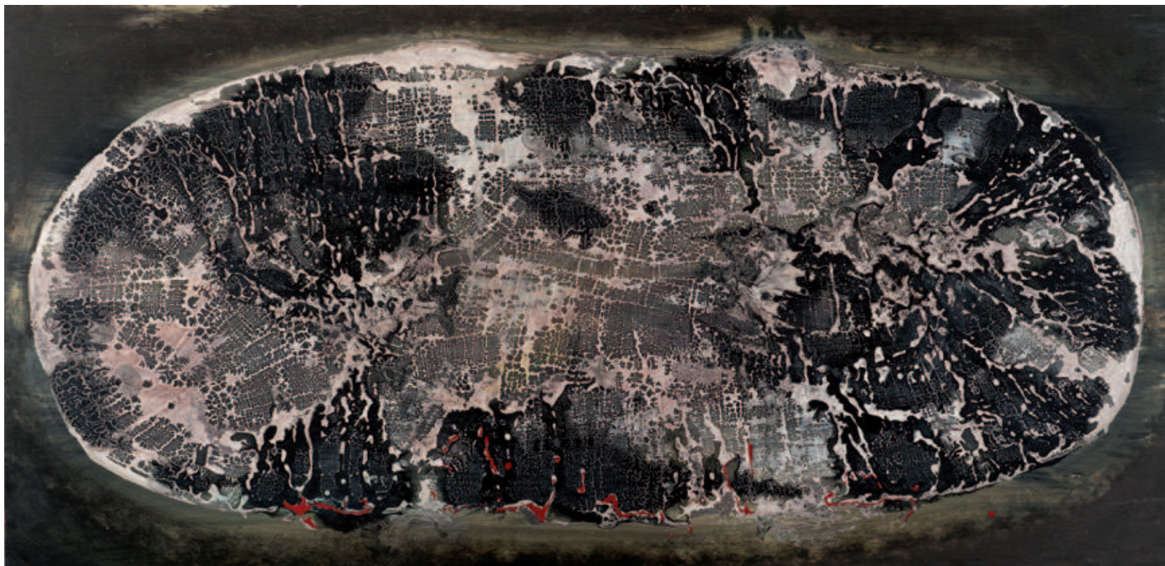
Vall Palou - Acrylic on wood - 250x122 cm - 2013